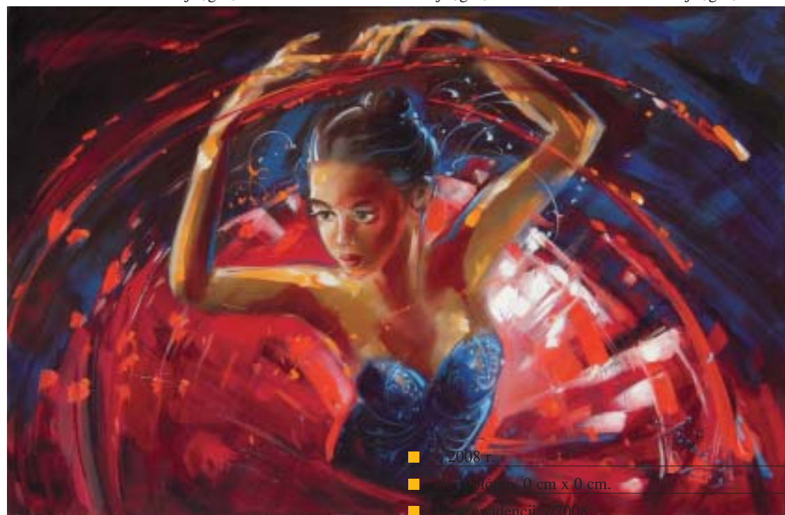
■ 2008 r. ■ olej / płótno, 0 cm x 0 cm. ■ Nr w ewidencji: /2008