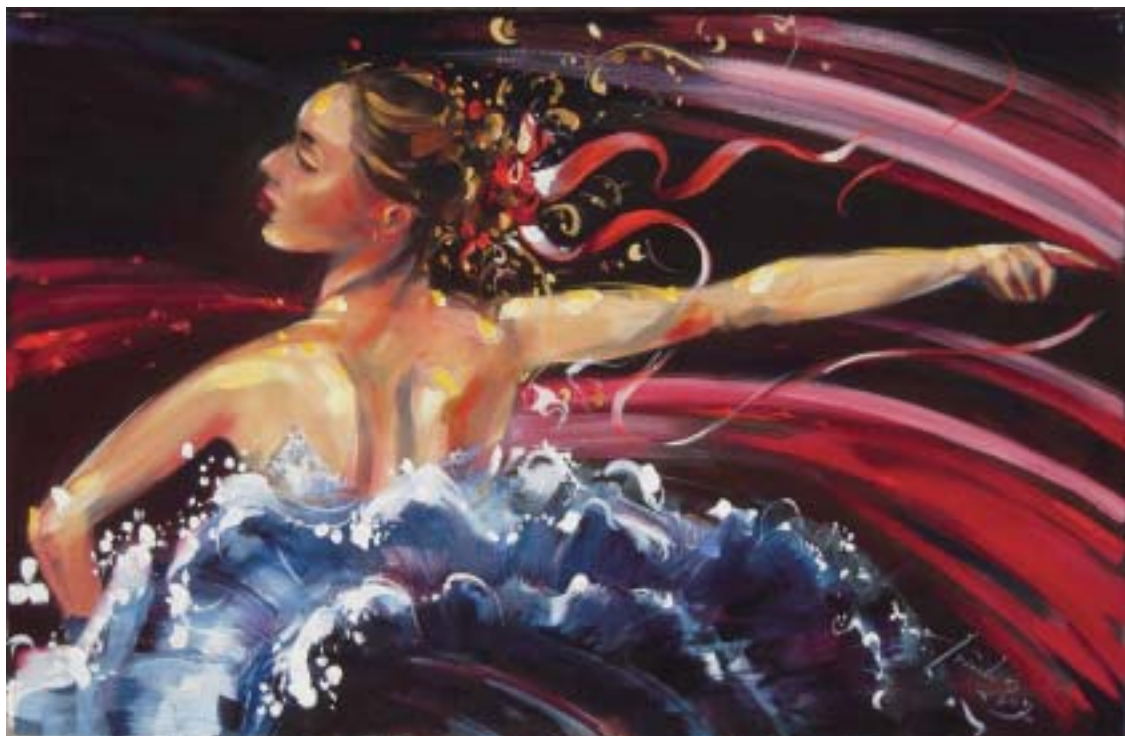
■ BALLERINA, 2009 r. ▲ ■ olej / płótno, 40 cm x 60 cm. ■ Nr w ewidencji: /g10/2009